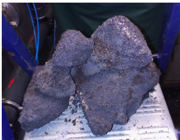
Рис. 2. Фильтрующий материал — сорбент АС (МС)

Каталитическая загрузка МЖФ в фильтрах второй ступени применяется для преобразования растворенных примесей двухвалентного железа и марганца в нерастворенные соединения и осадения их в гранулах фильтроматериала. Так как природные воды из поверхностных водных объектов не содержат соединения двухвалентного железа и марганца (железо и марганец присутствует в этих водах в виде органоминеральных комплексов), обезжелезивающие фильтры с МЖФ используются не по назначению.