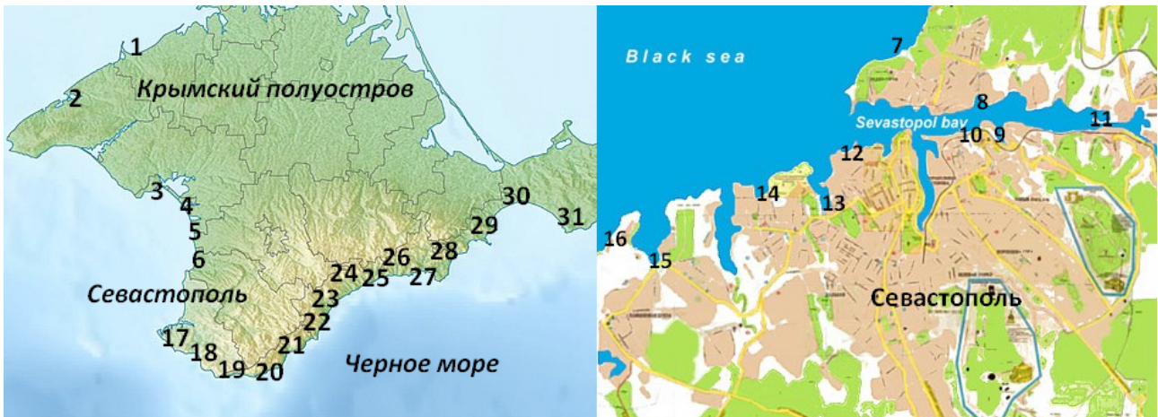
Рис. 1. Карта-схема расположения станций:

1 — поселок Портовое; 2 — поселок Межводное; 3 — Евпаторийский залив; 4 — поселок Новоефедоровка; 5 — поселок Песчаное; 6 — поселок Орловка; 7 — поселок Любимовка; 8 — бухта Голландия; 9 — Килен-бухта; 10 — бухта Аполлонова; 11 — мыс Николаевский; 12 — бухта Мартынова; 13 — бухта Карантинная; 14 — бухта Песчаная; 15 — бухта Круглая; 16 — бухта Камышовая; 17 — Золотой пляж; 18 — бухта Ласпи; 19 — поселок Форос; 20 — поселок Качивели; 21 — поселок Мисхор; 22 — мыс Мартыан; 23 — мыс Плака; 24 — поселок Малый Маяк; 25 — Профессорский уголок; 26 — город Алушта; 27 — поселок Малореченское; 28 — бухта Карадагская; 29 — поселок Орджоникидзе; 30 — Феодосийский залив; 31 — поселок Приморский