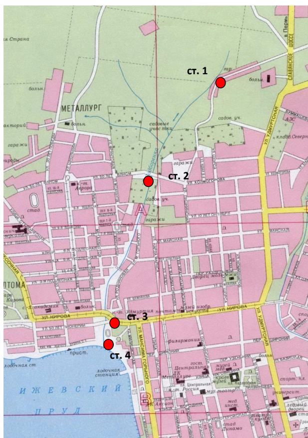
Рис. 1. Карта-схема расположения створов наблюдения на р. Подборенке: ● — створы наблюдения; створ № 1 — исток Подборенки; створ № 2 — Подборенка в районе улицы Холмогорова; створ № 3 — Подборенка в районе улицы Кирова; створ № 4 — устье Подборенки

оценки изменения расхода воды в реке произвели расчет площади водного сечения.