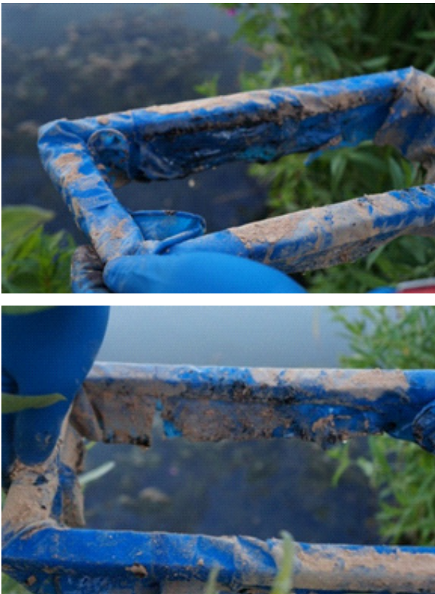
Рис. 5. Исследование сорбционных свойств полимерной ткани в условиях водного объекта

Насыщенный нефтью СМ предполагается не регенерировать, а использовать как вспомогательное топливо на объектах малой энергетики. Калориметрически определена теплота сгорания отработанного материала, которая составила 22,6 МДж/кг, что сравнимо по теплоте сгорания с каменными углями ( Q_p^H < 23,8 МДж/кг), Кузнецкого ( Q_p^H < 22,7 МДж/кг), Норильского ( Q_p^H < 22,6 МДж/кг), Якутского ( Q_p^H < 22,9 МДж/кг) бассейнов.