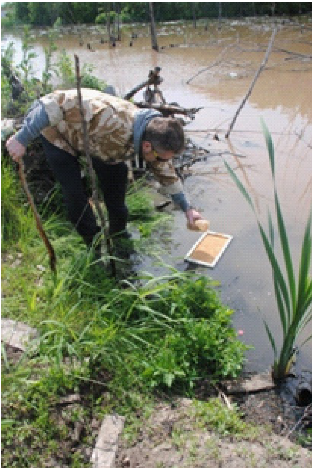
Рис. 3. Нанесение сорбента на поверхность воды, загрязненной нефтепродуктами

ти от места применения и количества разлитых нефтепродуктов. СМ доставляется к месту аварии в бункерах, установленных на судне. В область локализованных нефтепродуктов СМ распыляется с помощью устройства типа питатель