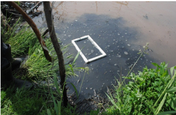
Рис. 2. Размещение рамки (имитации бонового заграждения) на исследуемом водном объекте

ти от места применения и количества разлитых нефтепродуктов. СМ доставляется к месту аварии в бункерах, установленных на судне. В область локализованных нефтепродуктов СМ распыляется с помощью устройства типа питатель