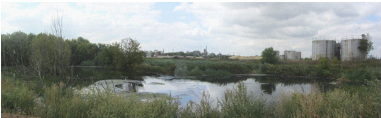
Рис. 1. Заболоченная старица реки Карла

Разлив нефти и нефтепродуктов на поверхности происходит обширным растеканием. Из-за разности полярности воды и нефтепродуктов не происходит перемешивание жидкостей. При растекании по поверхности слой нефтепродуктов стремится к уменьшению толщины. Для локализации разлива нефти и нефтепродуктов используются плавающие боны постоянной плавучести, марка бонов подбирается в зависимости